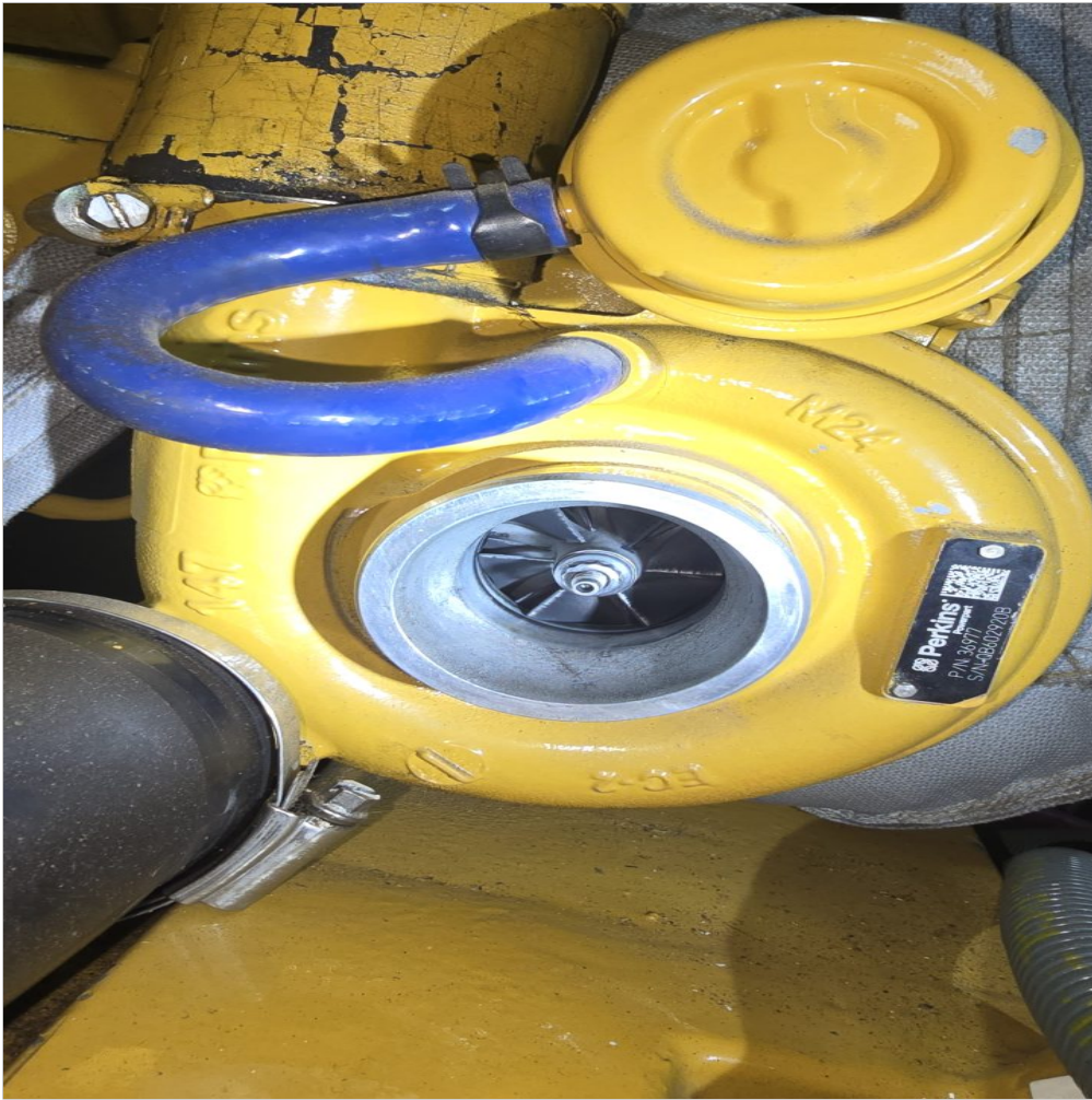
Inspeccion de turbocompresor