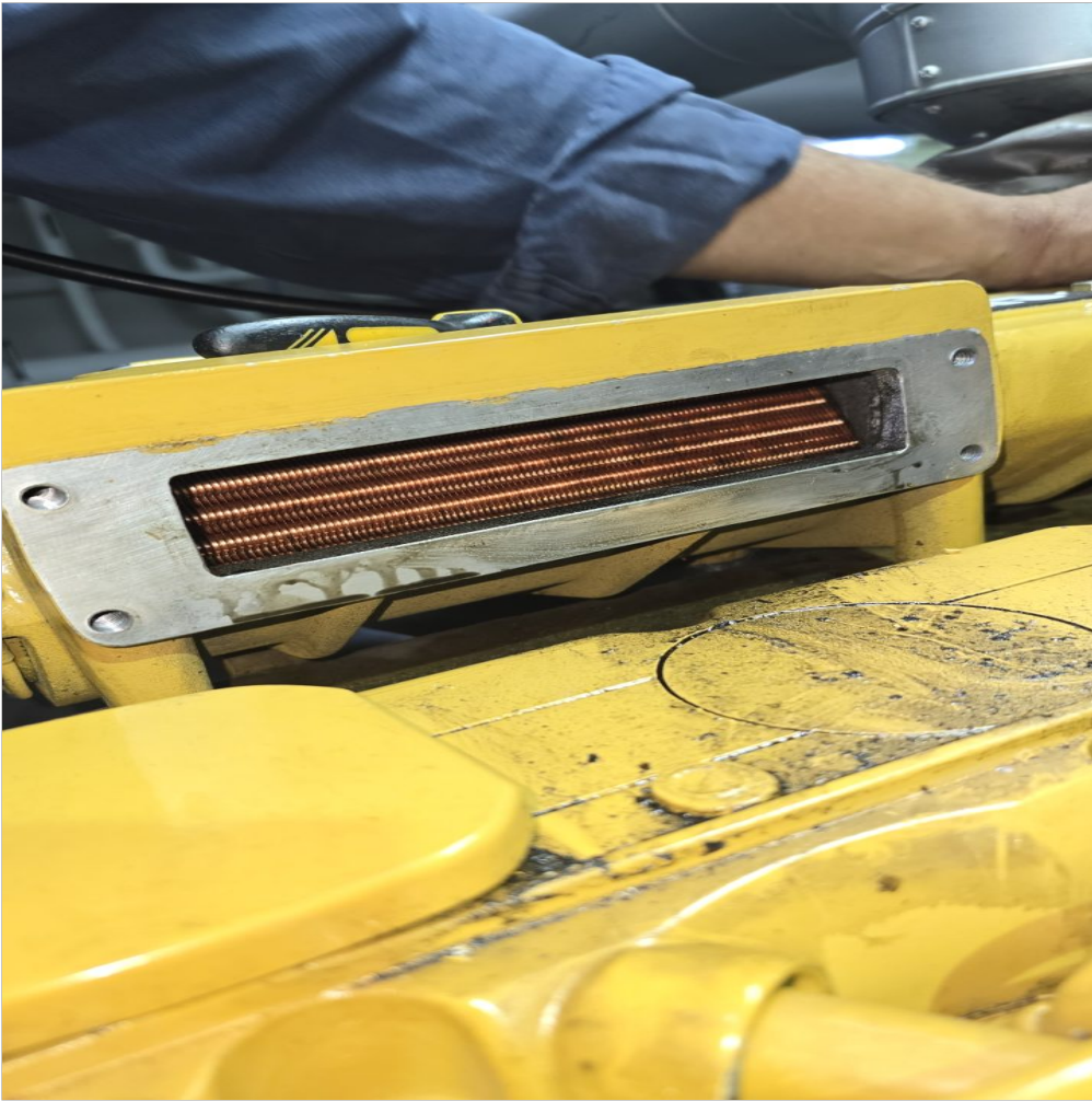
Circuito de admision de aire con aceite