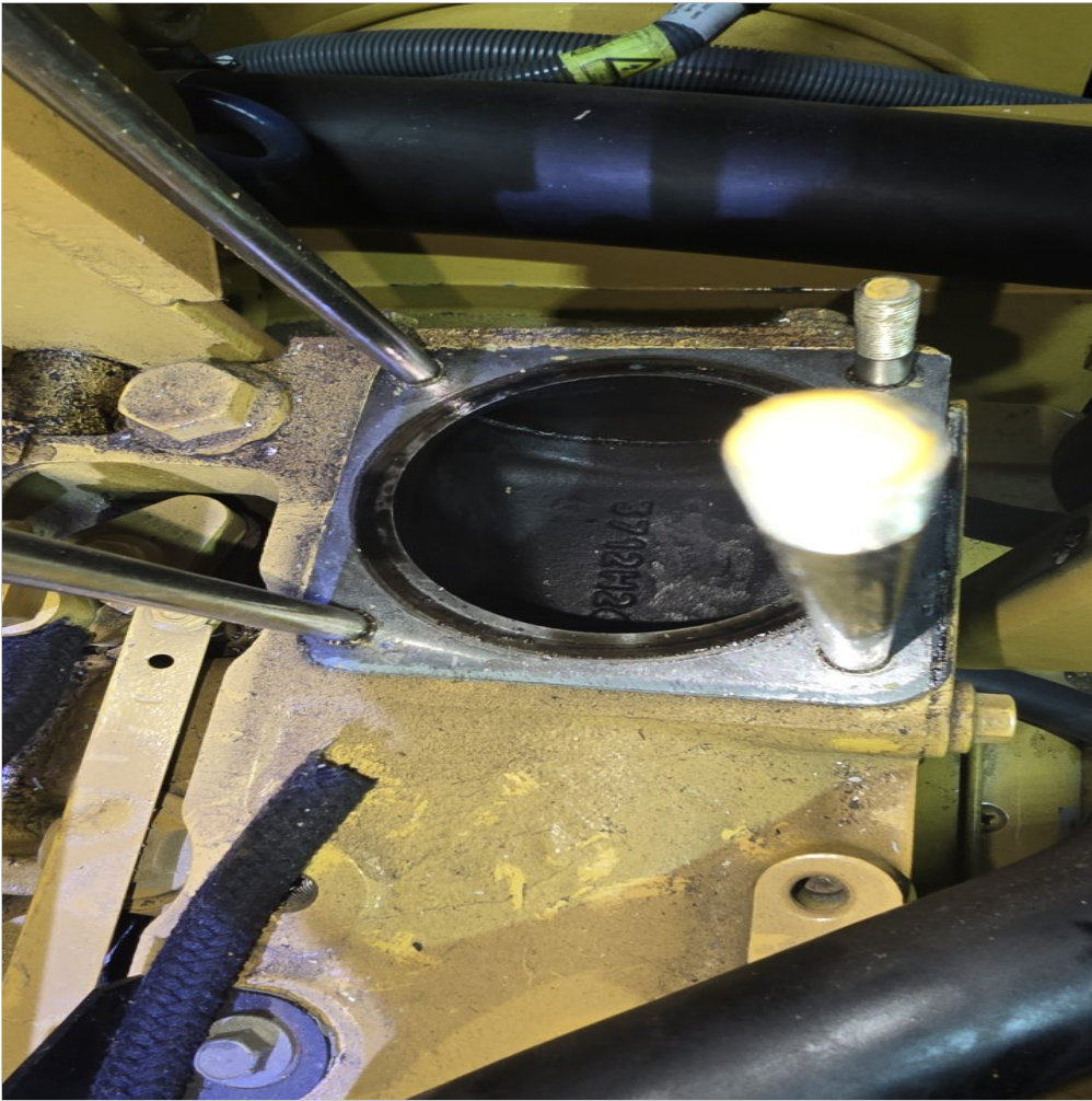
Circuito de admision de aire con aceite